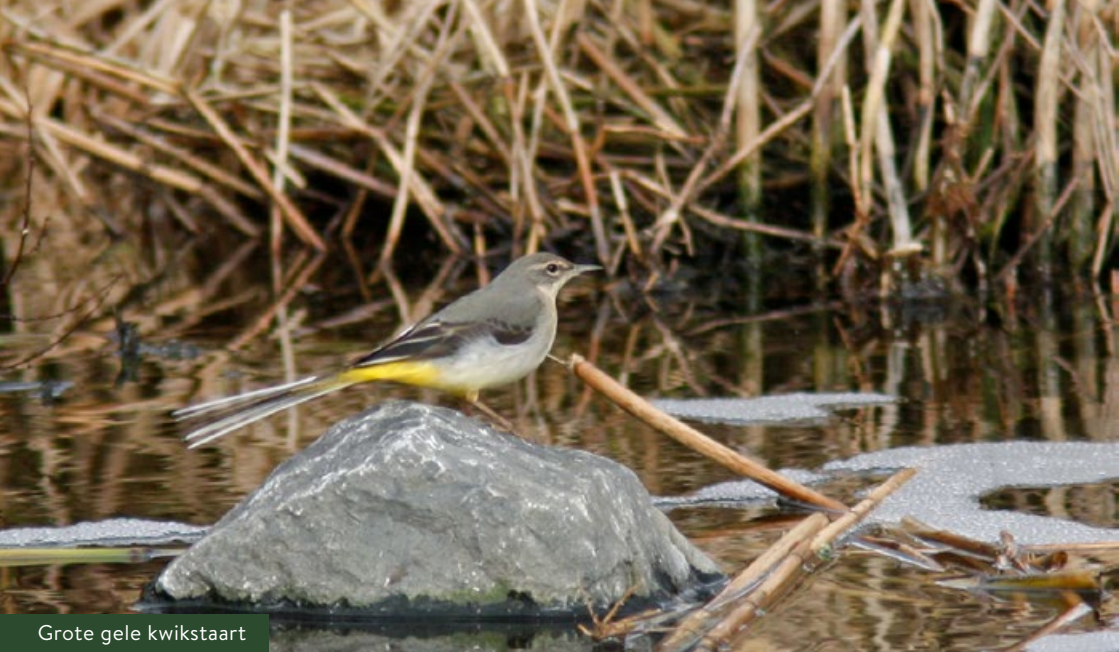
Grote gele kwikstaart